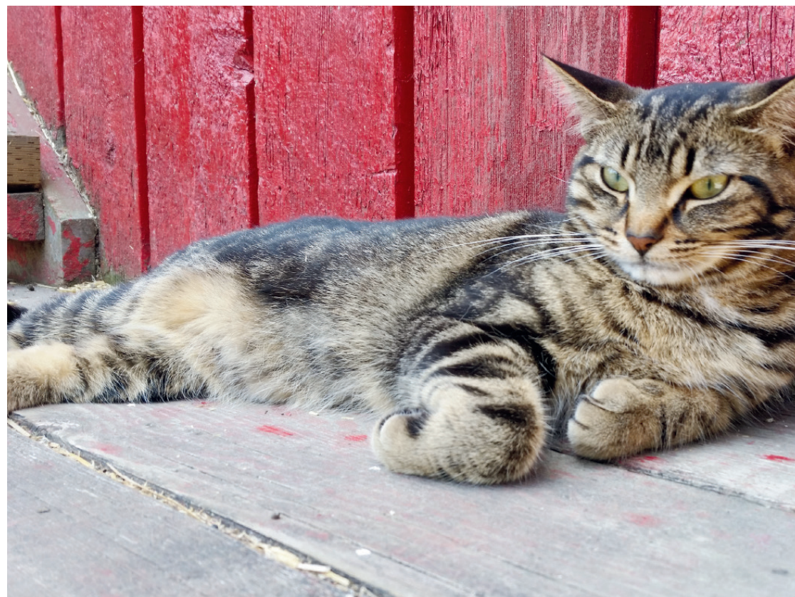
Communication SPA de Québec

Des milliers de chats sont recueillis chaque année à la SPA de Québec. Parmi nos pensionnaires félines, quelques-uns sont sauvages ou issus d'une colonie. D'autres sont domestiqués mais adorent leur liberté. Ce mode de vie nomade comporte toutefois son lot de difficultés dont le manque de nourriture, les intempéries ainsi que les activités de la vie urbaine. On remarque aussi que ces chats sont plus craintifs de l'humain et préfèrent la compagnie d'autres animaux.