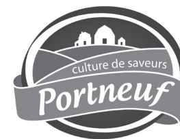
Table de concertation agroalimentaire de Portneuf : Assemblée générale annuelle

L'organisme voué au développement du secteur agroalimentaire portneuvois tiendra son assemblée générale annuelle le lundi 11 mars prochain, à 19 h 30 , à la salle Saint-Laurent de la MRC de Portneuf (185, route 138, à Cap-Santé).